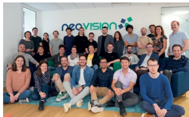
L'équipe de Neovision grandit de jour en jour : l'entreprise grenobloise a connu une croissance de 50% en 2021 et poursuit son ascension.

Del'industrie à la santé. Pour Pellenc ST (Pertuis/Vaucluse), un fabricant de machines de tri de déchets, Neovision a conçu une IA qui permet de distinguer les plastiques alimentaires et non alimentaires. Intégrée à la machine équipée d'un dispositif optique, l'IA reconnaît les déchets de plastiques, qui passent sur un tapis roulant, en moins d'1,5 ms avec seulement 6% d'erreur. « C'est mieux qu'avec un algorithme standard ; nous avons permis à l'IA d'apprendre, avec un grand nombre de photos de chaque sorte de plastique. »